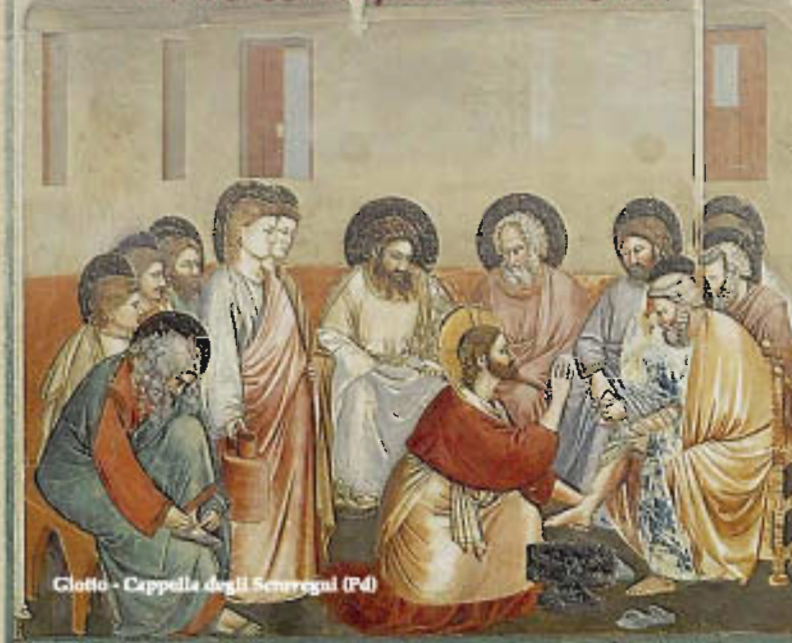
Giotto - Cappella degli Scrovegni (Pd)